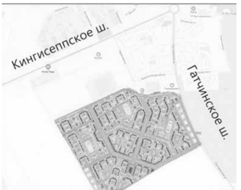
На сайте nsp.ru опубликована картинка будущего микрорайона - нескольких десятков жилых корпусов и социальных объектов, разделенных прямыми и диагональными улицами или проездами.

При прошлом обсуждении этих планов мы уже обращали внимание, что это историческая территория Военного поля, на которой проходили Красносельские маневры императорской гвардии. Никто не требует превращения всей огромной площади Военного поля в музей или ее сохранения в первозданном виде, которого и так давно нет. Однако каким-то образом увековечить Военное поле и проходившие на нем яркие события XIX – начала XX века необходимо. Есть опасение, что нынешний хозяин земли и будущие застройщики об этом даже не думают.